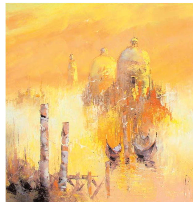
MANUEL RUBALO Brume, huile, 70x70cm www.manuelrubalo.com